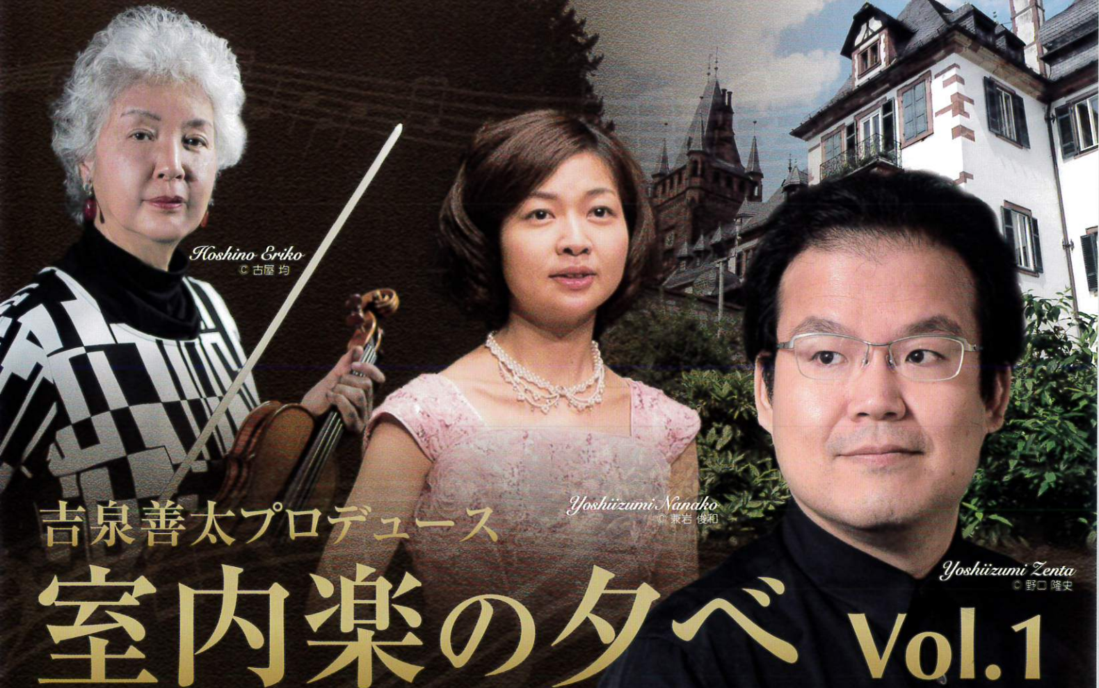
Koshino Eriko © 古屋 均