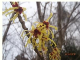
写真： マルバマンサク

時間 10:00～11:30 集合場所 公園事務所 参加費 無料 定員 10名 事前申込み 必要 ※先着順 準備 暖かく動きやすい服装 ※マスク着用をお願いします