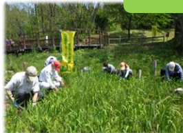
カキツバタの除草