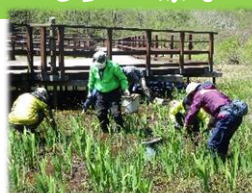
カキツバタの移植