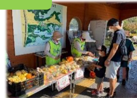
イベント時のサポート