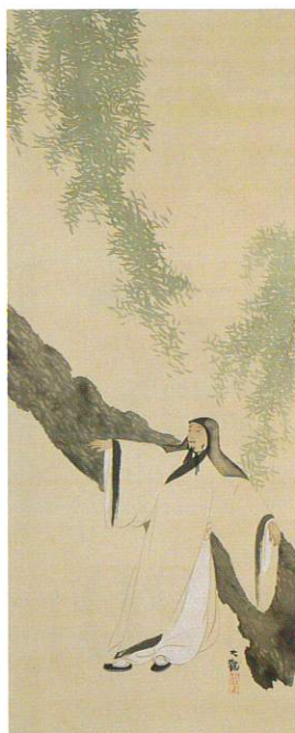
横山大観《五柳先生》個人蔵