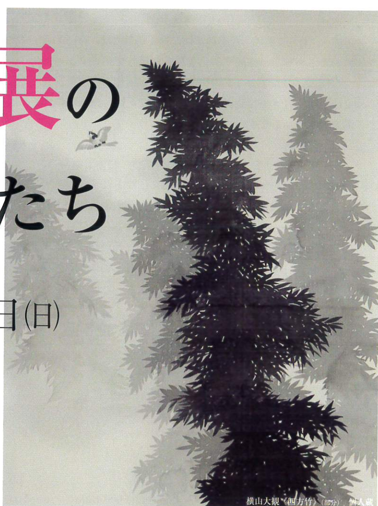
横山大観《四方竹》(部分) 個人蔵