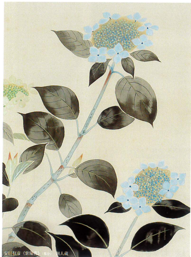
安田軋彦《紫陽花》(部分) 個人蔵