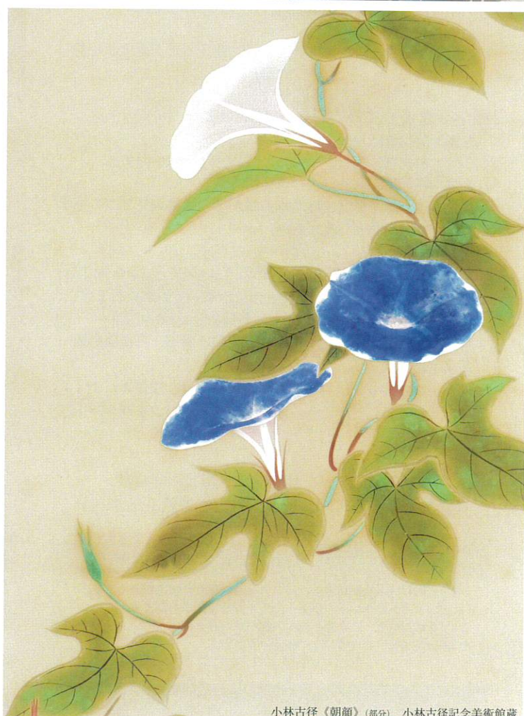
小林古径《朝顔》(部分) 小林古径記念美術館蔵