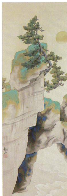
下村観山《海辺松》 小林古径記念美術館蔵