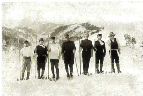
大日本スキー倶楽部高田支部 大正4年度スキー講習会