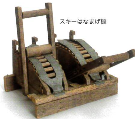
スキーはなまげ機