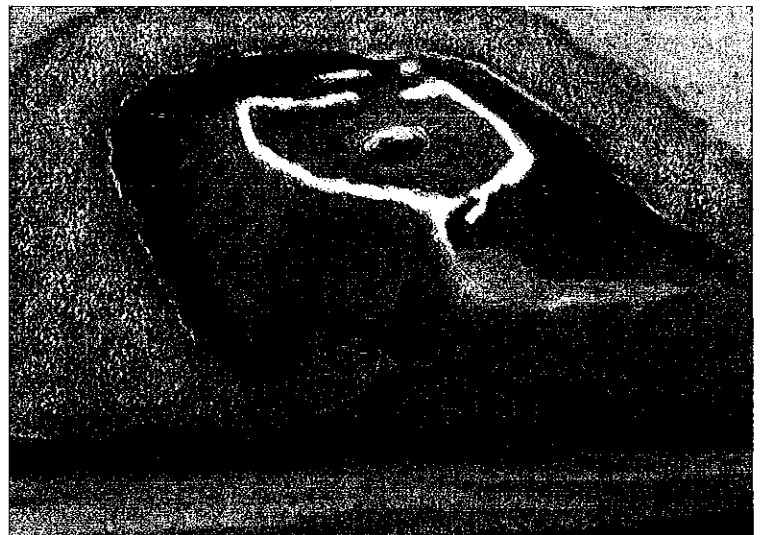
長峰城鳥瞰図(北側から) 制作・提供: 細井一貞