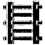
牧野家旗印 五間梯子