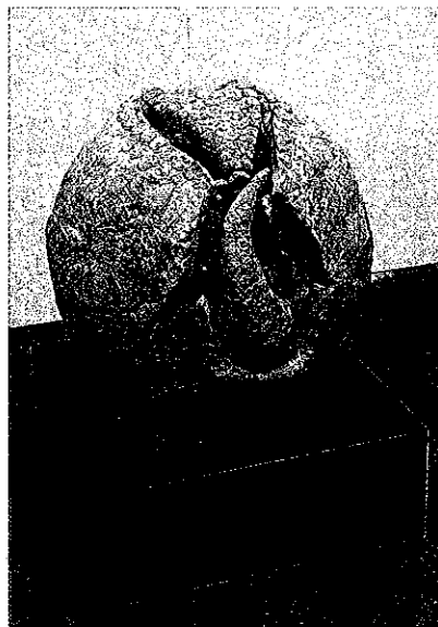
彫刻「ごろんとひと休み」斎藤明子(新潟田市)