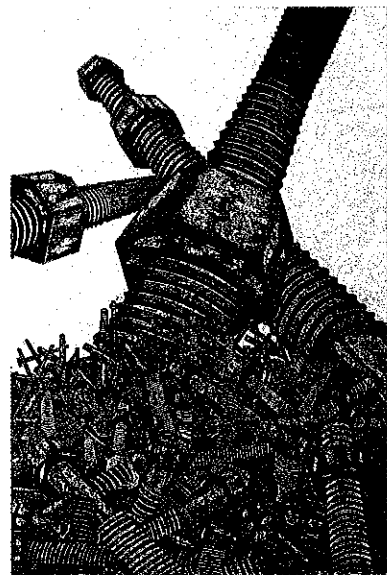
版画「ねじ 螺子」宇都宮俊次(長岡市)