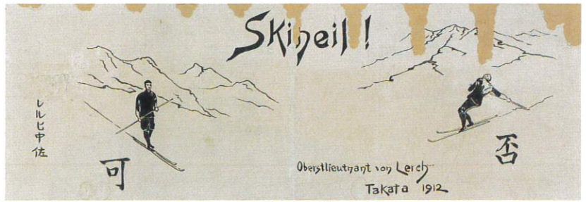
レルヒ画賛「シーハイル 可否」