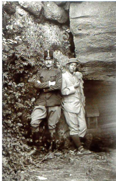
妙高山惣滝不動前のレルヒと岡倉一雄（岡倉天心長男）