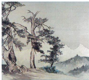
片桐文邦画「春日山松籟」〈日本スキー発祥記念館所蔵〉