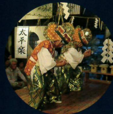
太平楽 (たいへいらく)