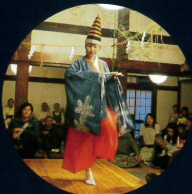
三番叟 (さんばそう)