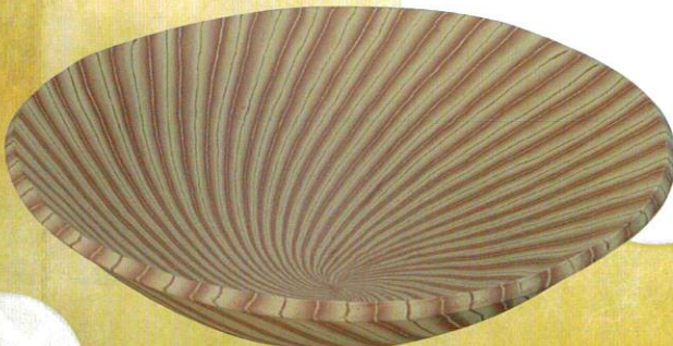
無名異練上線紋鉢 五代 伊藤赤水作