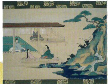
西行法師行状絵詞断簡