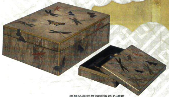
蝶蜻蛉蒔絵螺鈿料紙箱及硯箱