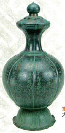
重要文化財 大和額安寺五輪塔納置品