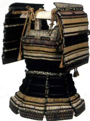
重要文化財 色々威腹巻 大袖付