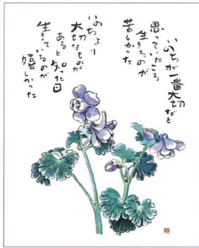
『いのち』(オダマキ) 1986年