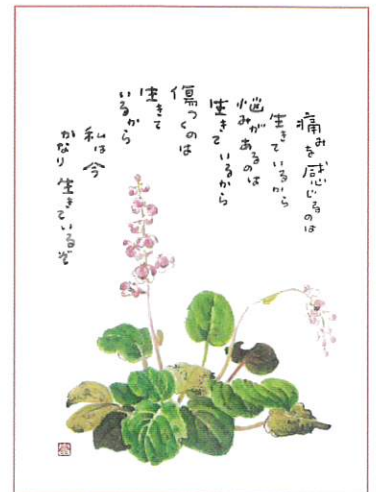
『生きているから』(イチヤクソウ) 1997年