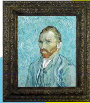
フィンセント・ファン・ゴッホ 《自画像・複製》