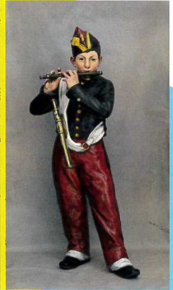
エドゥアール・マネ 《笛を吹く少年・複製》立体再現