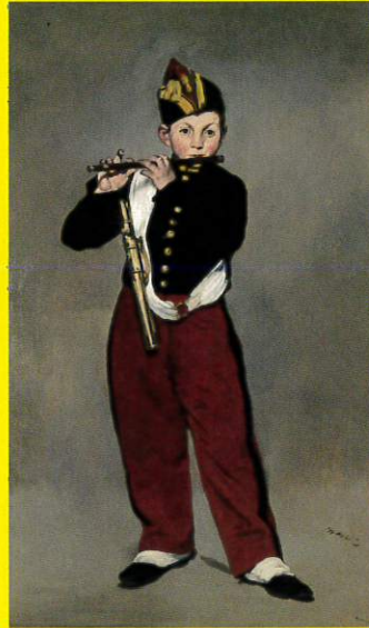
エドゥアール・マネ 《笛を吹く少年・複製》