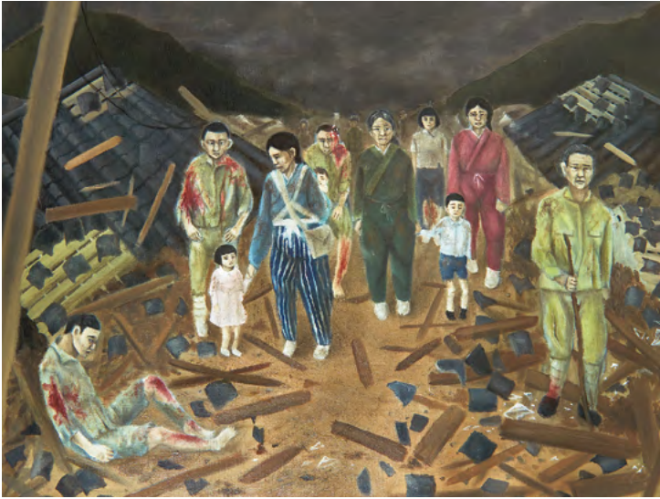
「避難する家族と7歳の私」

～ 広島市立基町高等学校の生徒が被爆の実相を後世に残すために 被爆者と共同で作成した「原爆の絵」の展示 ～