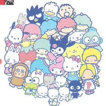
※画像は実際の展示作品とは異なる場合があります。

マイメロディ、リトルツインスターズ、ポムポムプリンなど、大人気のキャラクターを詳しくご紹介します。