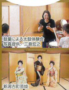
鼓童による太鼓体験会