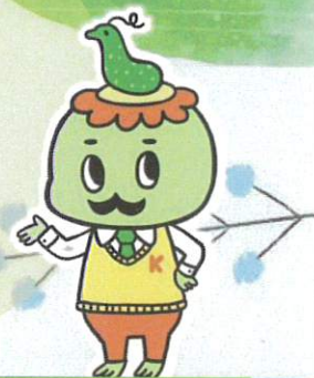
大潟水と森公園PRキャラクター かっぱかせ