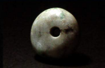
ヒスイ製大珠 北海道函館市浜町A遺跡 縄文時代中期 市立函館博物館蔵