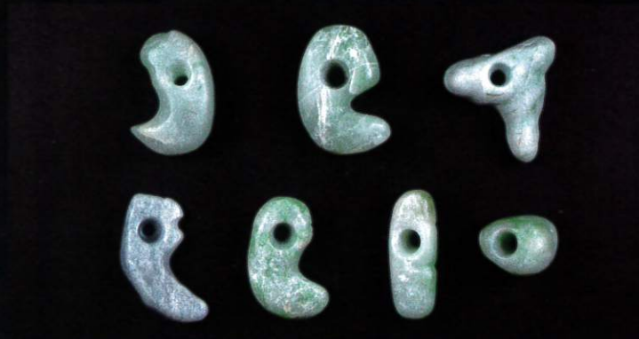
ヒスイ製勾玉・垂玉 青森市朝日山(1)遺跡 縄文時代晩期 青森県埋蔵文化財調査センター蔵