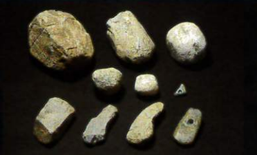
ヒスイ製大珠の製作工程品と成品 糸魚川市長ヶ原遺跡・井ノ上遺跡 縄文時代中期 糸魚川市教育委員会蔵