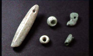
ヒスイ製垂玉・丸玉ほか 鹿児島県鹿屋市町田堀遺跡 縄文時代後期 鹿児島県立埋蔵文化財センター蔵 ※鹿児島県指定文化財