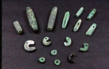
結晶片岩様緑色岩製の勾玉・管玉・平玉ほか 鹿児島県南さつま市上加世田遺跡 縄文時代後期 南さつま市教育委員会蔵