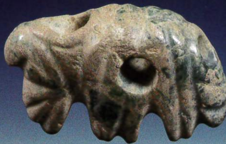
結晶片岩緑色岩製獣形勾玉 鹿児島県南さつま市上加世田遺跡 縄文時代後期 鹿児島県立埋蔵文化財センター蔵