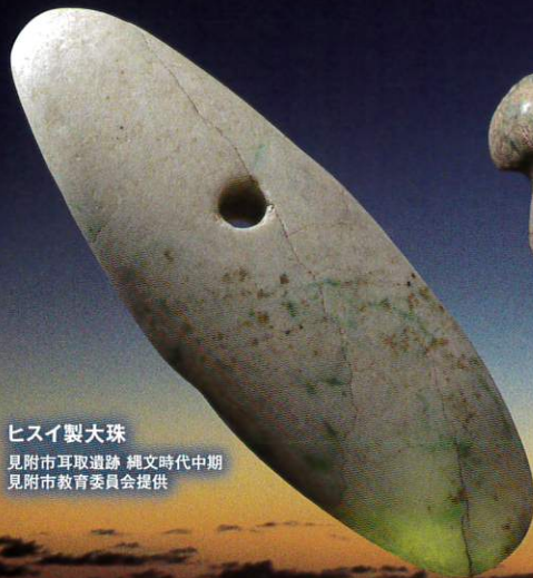
ヒスイ製大珠 見附市耳取遺跡 縄文時代中期