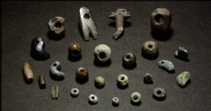
ヒスイ製丸玉ほか 上越市龍峰遺跡 縄文時代後・晩期 上越市教育委員会蔵 ※新潟県指定文化財