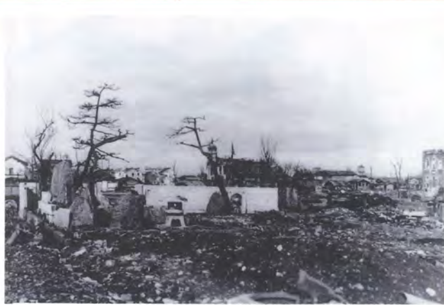
表町・本町・中島方面をのぞむ

長岡空襲の実相を記した空襲写真・体験画パネル・実物資料