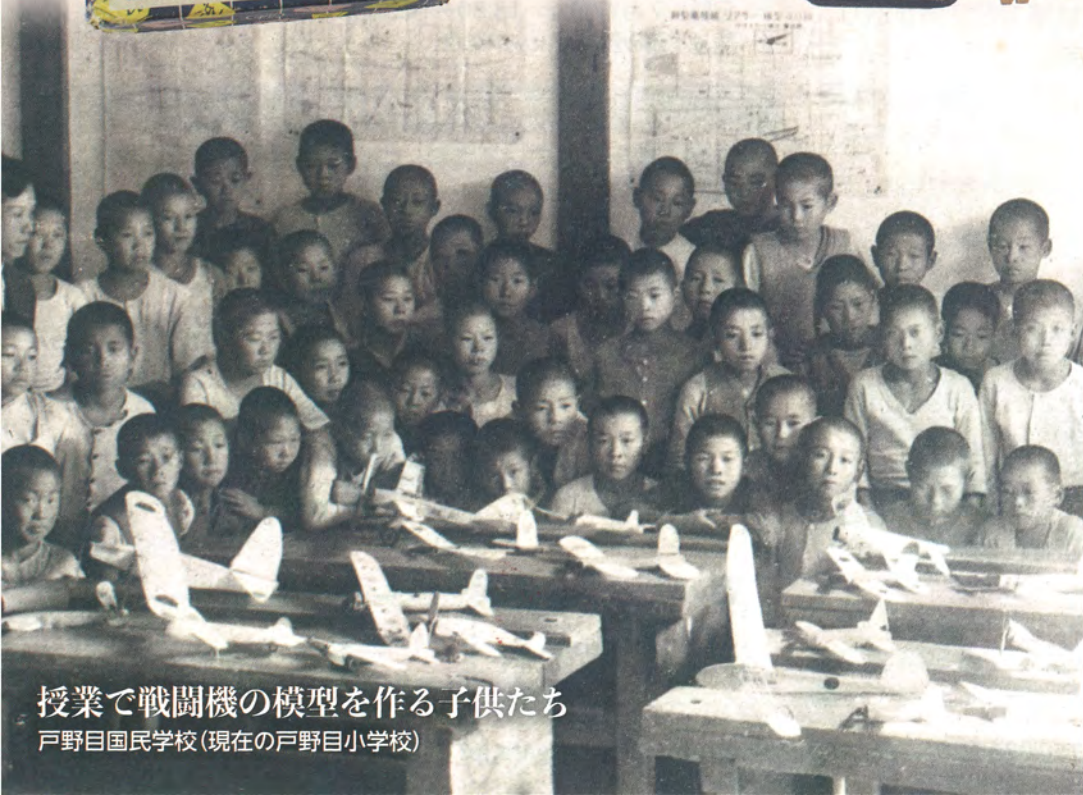
授業で戦闘機の模型を作る子供たち 戸野目国民学校(現在の戸野目小学校)

「子供と戦争」の関わりを伝える資料展示 子供たちのまわりには、いつも「戦争」がありました