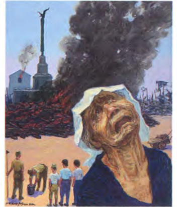
平湯神社の忠魂碑下の合同火葬