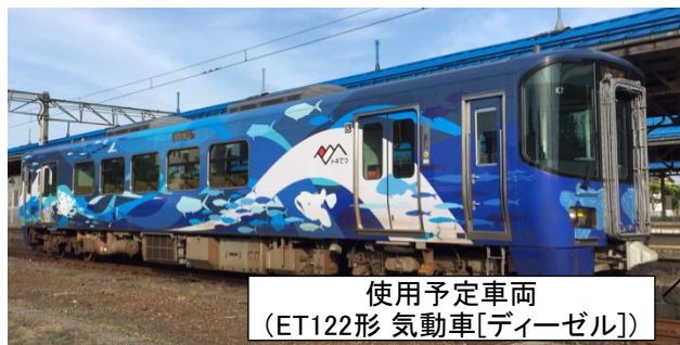
使用予定車両 (ET122形 気動車[ディーゼル])