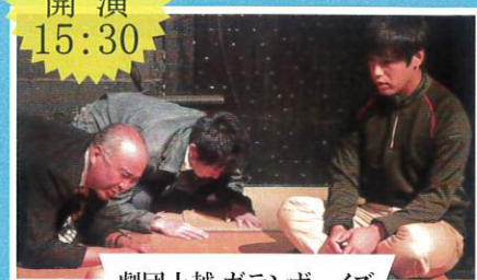
劇団上越 ガテンボーイズ