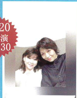
舞台芸術集団 シーシャイン