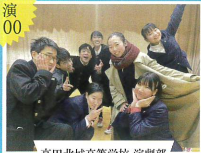
高田北城高等学校 演劇部