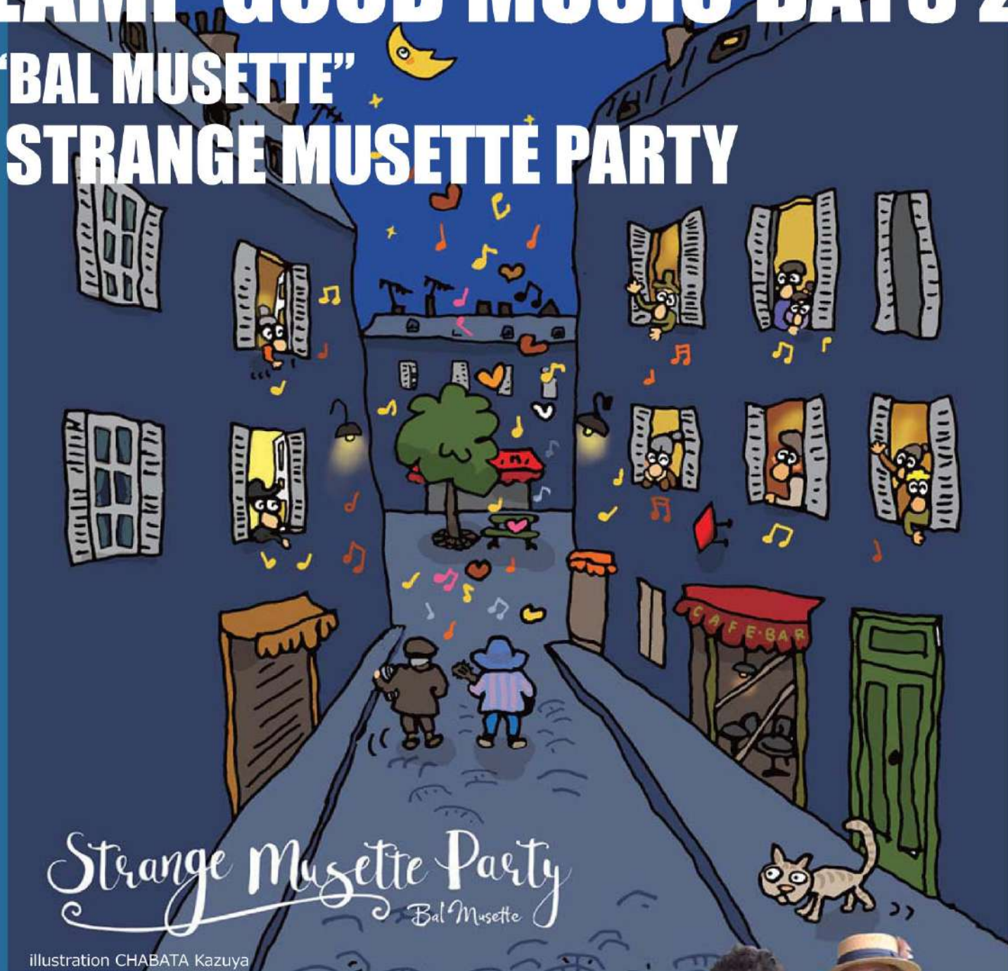
illustration CHABATA Kazuya