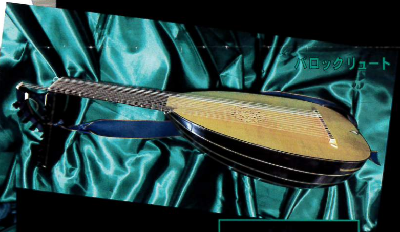
バロックリュート