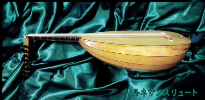
ルネサンスリュート