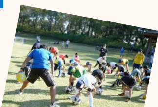
アルビレティース ボールで遊ぼう！