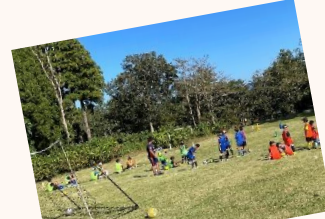
アルビサッカースクール サッカー教室