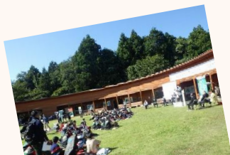
開園20周年記念式典