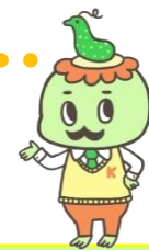
大潟水と森公園 PR キャラクター かっぱかせ

Twitter・facebookも更新中！ 大潟水と森公園 @mizutomori フォロー・いいね！お待ちしております★