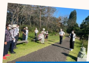
かっぱ像ウォーク