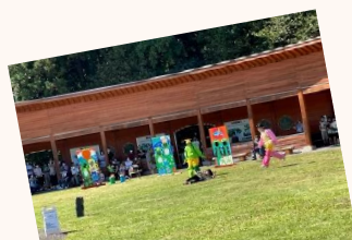
演劇 大潟かっぱ物語