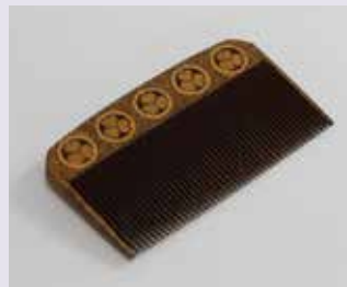
勝（高田姫）所用 芭蕉葵紋高時絵櫛（天崇寺所蔵）