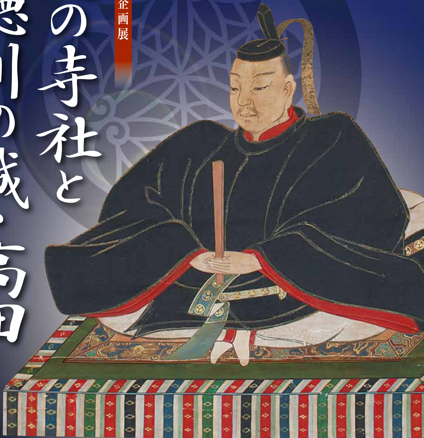
徳川秀忠像（天崇寺所蔵）