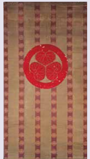
善導大師前簾（善導寺所蔵）