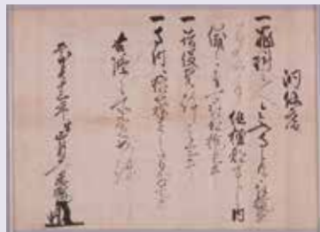
松平忠輝制札（上越市文化財 栄樹寺所蔵）