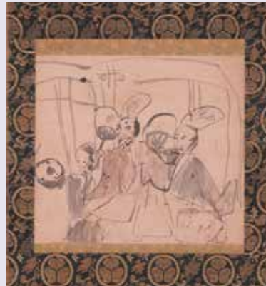
伝徳川家康筆三河万歳図（称念寺所蔵）