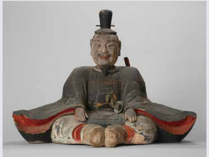
東照大権現座像（天崇寺所蔵）