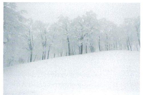
「八海山の樵の雪森」

北海道ニセコエリアで活動する写真家・渡辺洋一は、スキーヤーでもありスキー写真において日本を代表する写真家の一人です。世界の降雪地を見てきた渡辺は、自身の原点である日本の雪森に注目し、スキーを履き雪山に分け入った際に出会った景色を記録しています。作品を通し、豊かな自然を未来に継承するため、人と自然とがどう共生すべきかを考えるきっかけになれば幸いです。