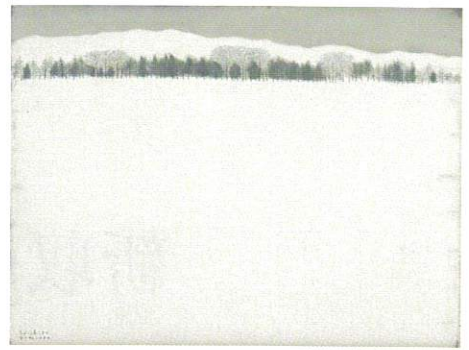
雪原 制作年不明 / F20

自然への敬愛の念を抱く二人の作家が、壮大で厳しくも美しい自然に身を投げ、それぞれの視点で表現した作品を展示します。