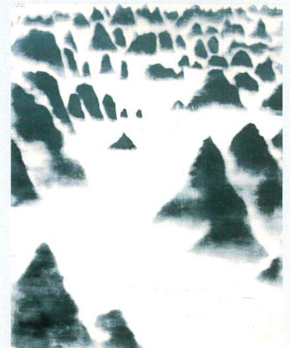
桂林山水・高田 1982年/F100