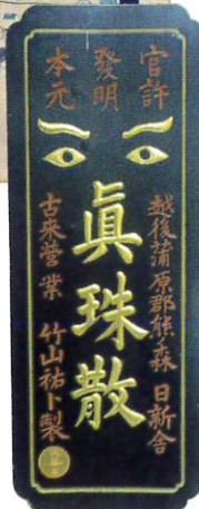
真珠散 看板 燕市分水良寛史料館蔵