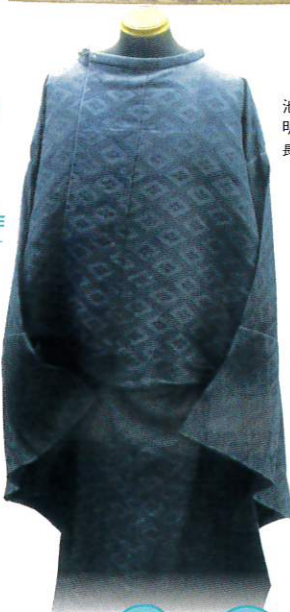
池田謙斎拝領 明治天皇の御衣 長岡市蔵