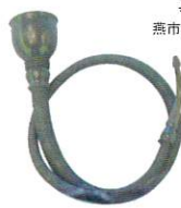
入澤恭平 (達吉の父) 使用の聴診器 長岡市蔵